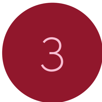
Workshops nieuwe medewerkers