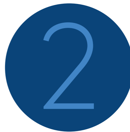
Bijeenkomsten Stuurgroep Kwaliteit Openbaar Bestuur

Bekijk de website www.integriteitlimburg.nl